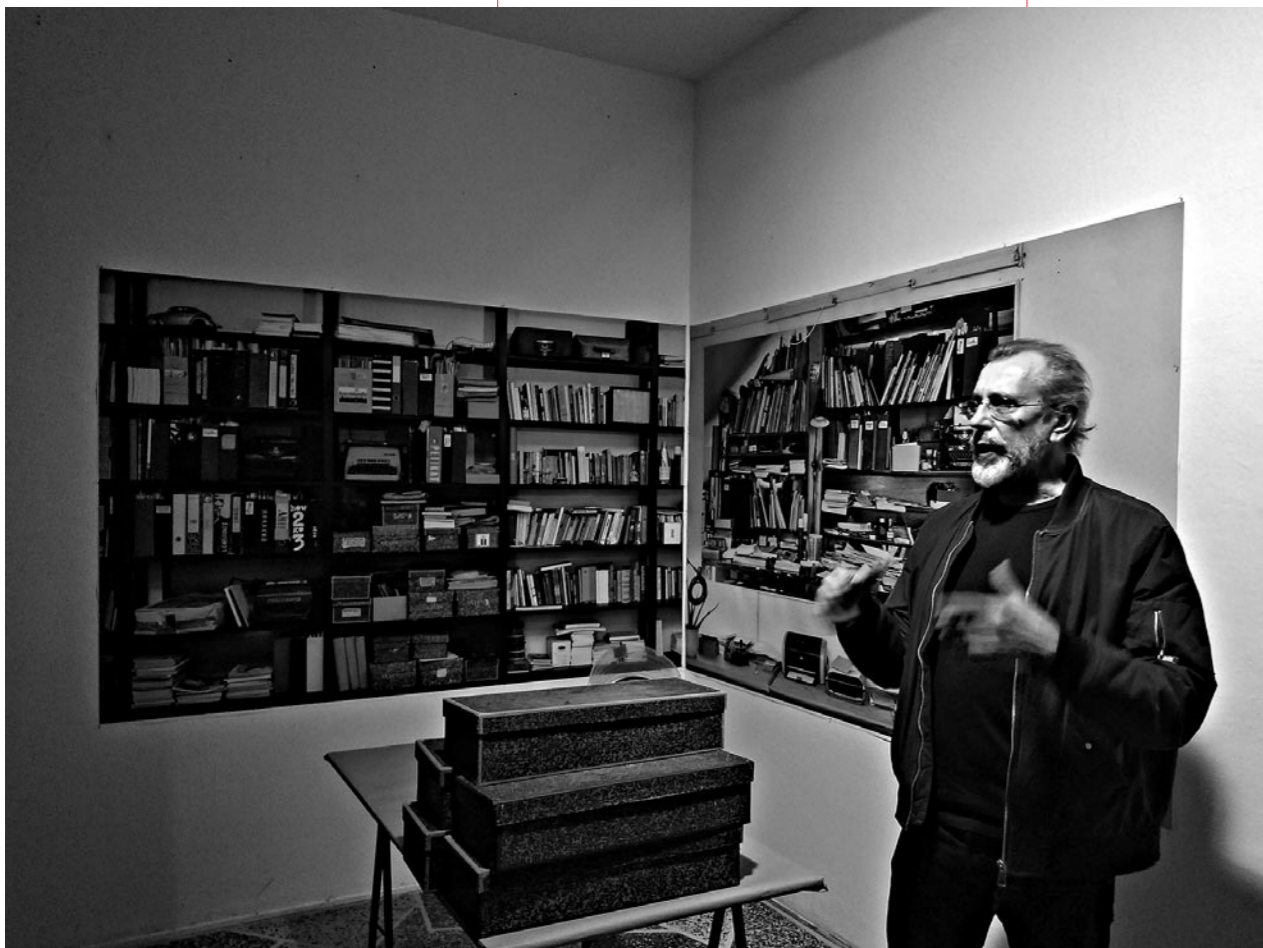
instalacija i performans na promociji knjige Osvojena područja – Volumen 7 , Galerija Greta, prosinac 2019.

10 Potrošnja električne energije za grijanje velikog prostora bila je neoboriv argument za boravak u malom i ljetni ga dani ostavljaju bez formalnog alibija za daljnji ostanak u kuhinji. Ne da mu u velikoj sobi nije ugodno, nego mu je i ovdje sasvim dobro. Gleda unaprijed, ponovno će stići jesen.