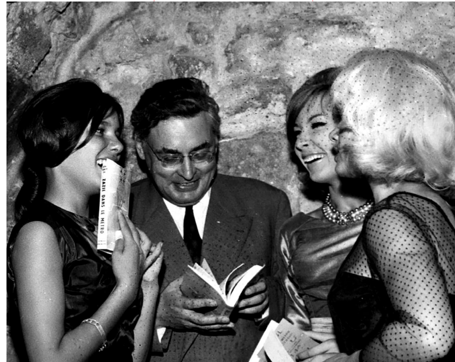
Raymond Queneau prilikom promocije knjige Zazie Dans Le Metro , Pariz, 1959.